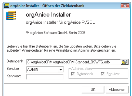
orgAnice Installer - Öffnen der Datenbank