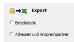
Auswahl orgAnice → Excel Export

Hier wird unterschieden zwischen dem Export von Einzeltabellen und dem Export von Adressen mit Ansprechpartnern.