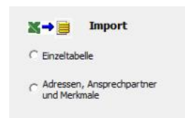
Auswahl Excel → orgAnice Import