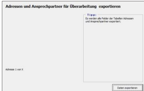
Abbildung: Adressen und Ansprechpartner exportieren

Hier ist keine Tabellenauswahl notwendig. Es werden alle in orgAnice sichtbaren Adressdatensätze sowie die zugehörigen sichtbaren Ansprechpartner-Datensätze in eine Excel-Tabelle übertragen.