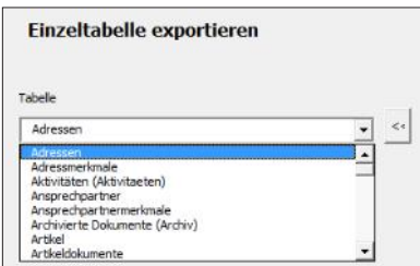
Auswahl einer orgAnice Tabelle

Nach der Auswahl einer beliebigen orgAnice-Tabelle und eines Index erfolgt unmittelbar der Export in die Excel-Tabelle.